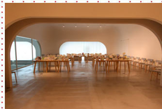
展示・ショー会場 武蔵野プレイス「ギャラリー」