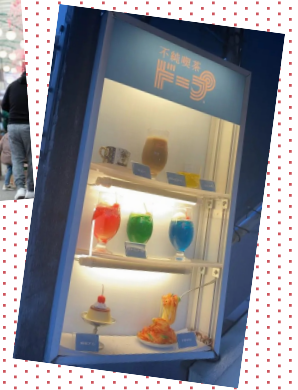
↑ ネオ喫茶店のブーム