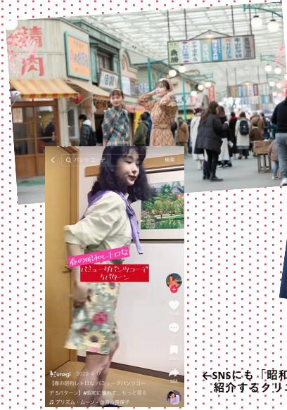
← 昭和レトロをコンセプトにした西武園ゆうえんち