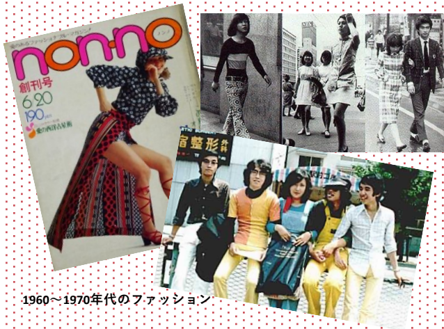
1960~1970年代のファッション

①世代間交流ができ、②参加する高齢者が役割を持って、参加できるイベントを開催したいと考え、近年Z世代をはじめとした若者の“レトロブーム”に、今の高齢者の若い頃のカルチャーがまさにマッチすることから、今回は特に1960~70年代の「ファッション」に着目した企画を提案する。