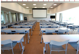
ワークショップ会場 武蔵野プレイス「フォーラム」

市民施設のギャラリーにてスナップ写真やDAY1,2のワークショップの様子の展示を行う。ギャラリー内にランウェイを作り、参加者自身がモデルとなりファッションショーを行う。