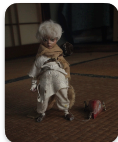
浴槽の上に副島の映像作品に出た 実物の人形を設置